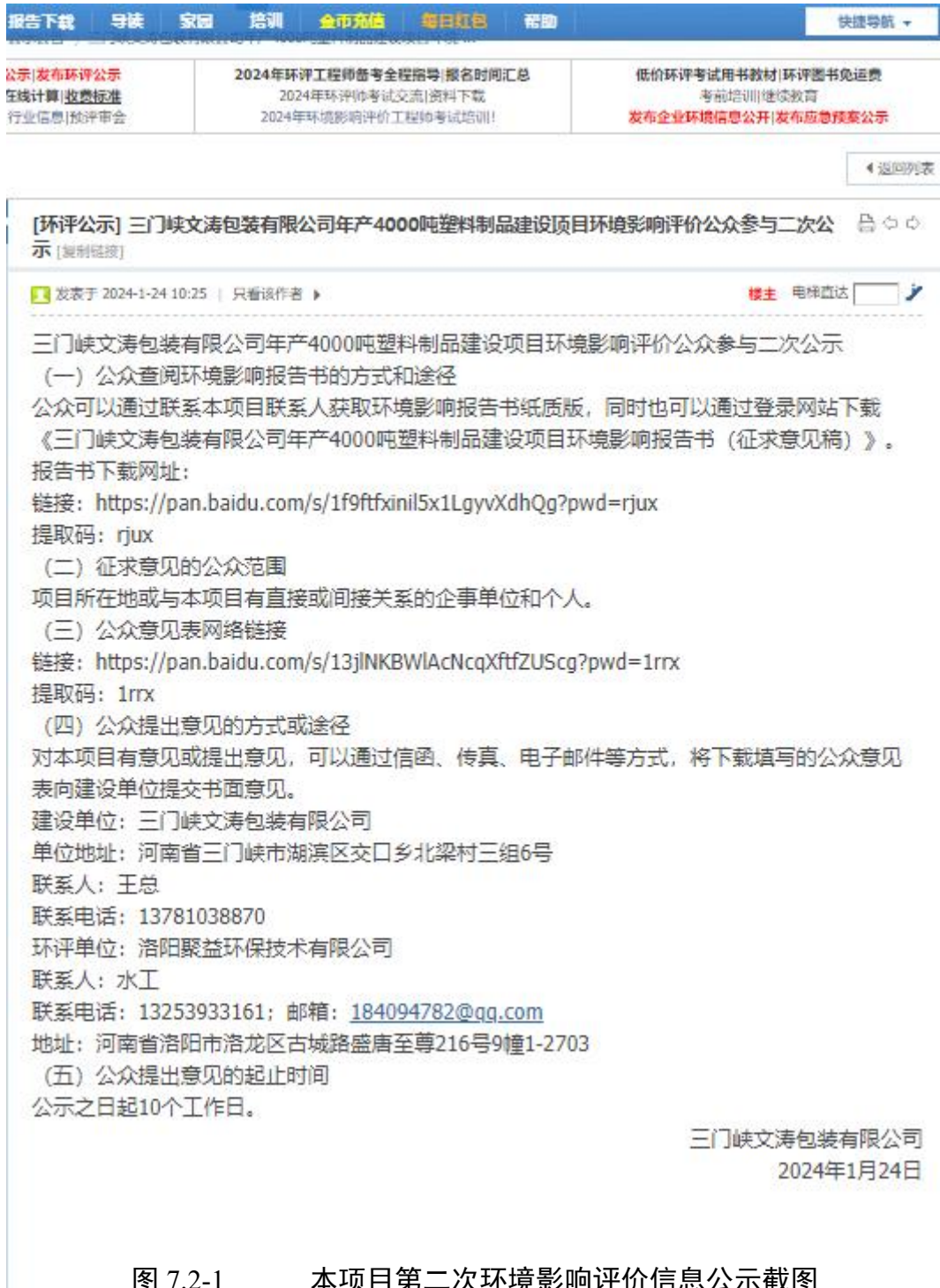
图 7.2-1 本项目第二次环境影响评价信息公示截图

为方便当地村民了解项目信息，建设单位于2024年1月24日在本项目所在地村委会公告栏张贴公示信息，公示照片见图7.2-3。