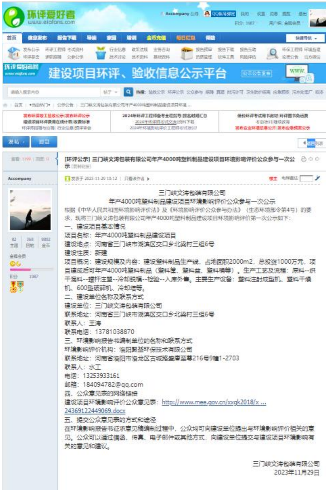
图 6.1-1 本项目首次环境影响评价信息公示截图